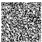
家族・当事者のつどい開催予定表